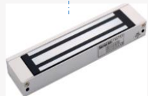
Hik電気錠（サードパーティ製品も使用可能）

■顔認証端末はVMSで追加、管理、定期的にジョブカンクラウドシステムからスタッフ情報を同期可能、打刻情報はジョブカンに即時反映する。