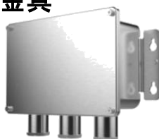
DS-1284ZJ-M ジャンクションボックス